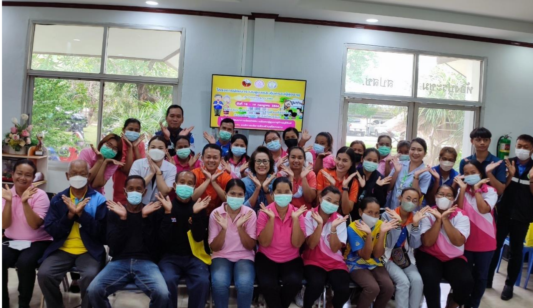
ภาพการขับเคลื่อนธนาคารเวลา องค์การบริหารส่วนตำบลโคกกลาง อ.ลำปลายมาศ จ.บุรีรัมย์