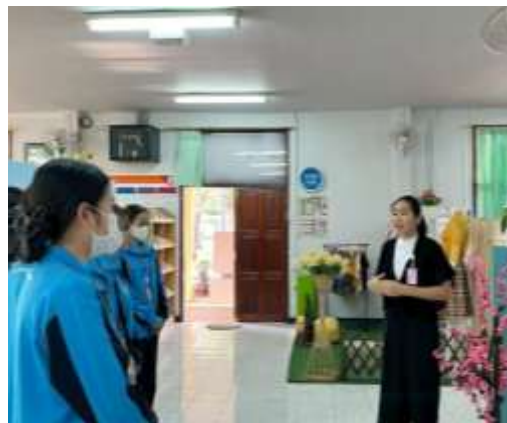
ภาพบรรยากาศการใช้อาคารสถานที่ศูนย์เรียนรู้ในการฝึกงานของนักศึกษา