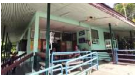
7. อาคารเรือนนอน 3 พุทไธสง