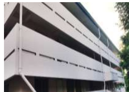
14. แพลตซาราชการและเจ้าหน้าที่