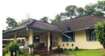
2. อาคารศูนย์เรียนรู้