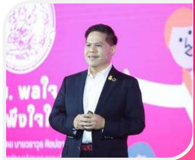
นายวรารุช คิลปะอาชา

รัฐมนตรีว่าการกระทรวงการพัฒนาสังคมและความมั่นคงของมนุษย์