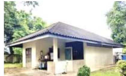
12. อาคารโรงซักล้าง