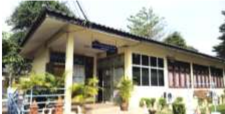
1. อาคารอำนวยการ