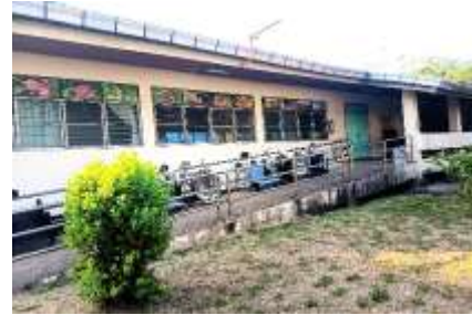
10. อาคารชีวภิบาลหญิง