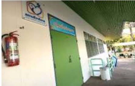
9. อาคารชีวภิบาลชาย