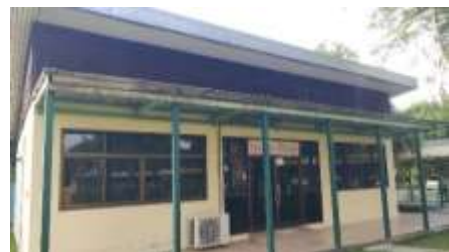
4. ห้องประชุม (Happy home)