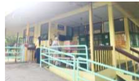
6. อาคารเรือนนอน 2 นางรอง