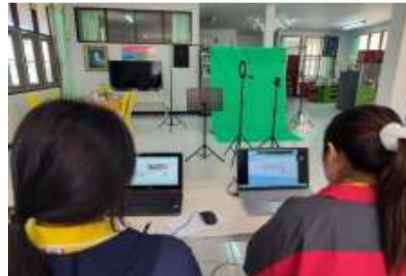
ภาพบรรยากาศการส่งเสริมการเรียนรู้ตลอดชีวิตของผู้สูงอายุ และเครือข่ายผู้สูงอายุในพื้นที่