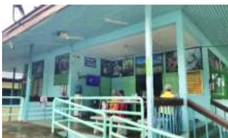
5. อาคารเรือนนอน 1 ประโคนชัย