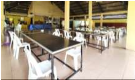
11. โรงอาหาร